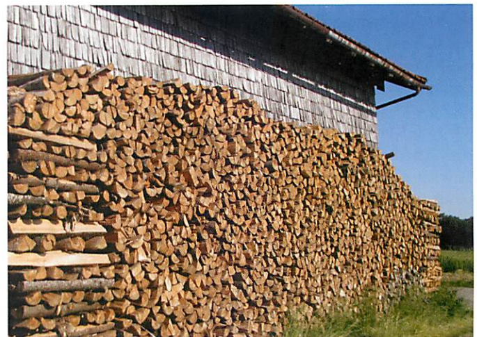
Vorbildlich gelagertes Brennholz

Anlaufstellen für Fragen rund um Produktion und Lagerung von Scheitholz sind die Ämter für Ernährung, Landwirtschaft und Forsten und die Zusammenschlüsse der Waldbesitzer. Adressen hierzu finden Sie unter: www.forst.bayern.de