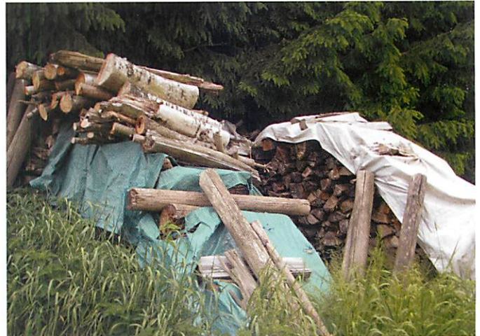
Im Wald gelagertes Brennholz trocknet langsamer aus; es besteht die Gefahr des »Verstockens«.

Heizen Sie nur mit naturbelassenem, lufttrockenem Holz mit einem Wassergehalt von maximal 20%. Sowohl Buche als auch Fichte (bzw. Kiefer) trocknen auf Wassergehalte unter 20% innerhalb eines Jahres – richtige Lagerung vorausgesetzt.